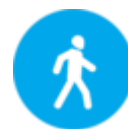
Знак 4.5 «Пешеходная дорожка»